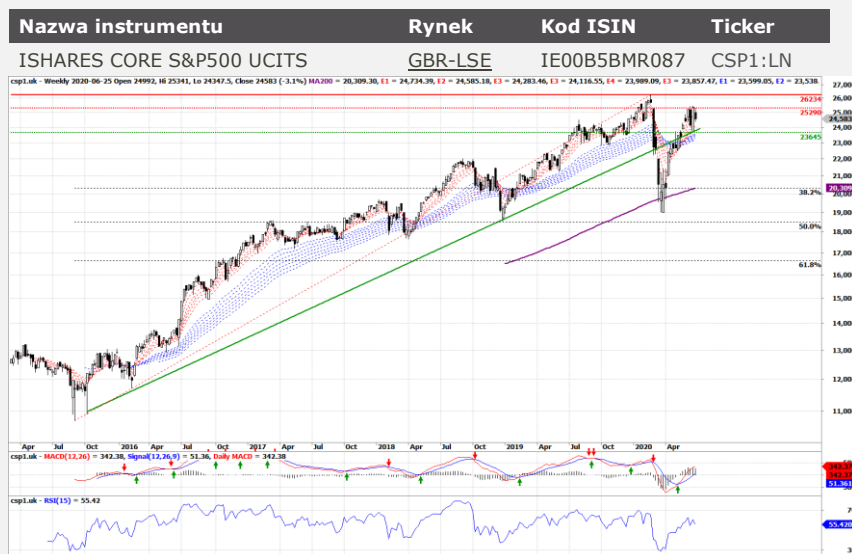
Rysunek 2. ISHARES CORE S&P500 UCITS. Wykres tygodniowy, świecowy. Opracowanie własne na podstawie stoog.pl